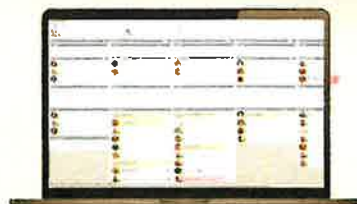
Dashboard/Softphone giver dig fuldt overblik