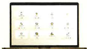
Selvbetjening via web browser